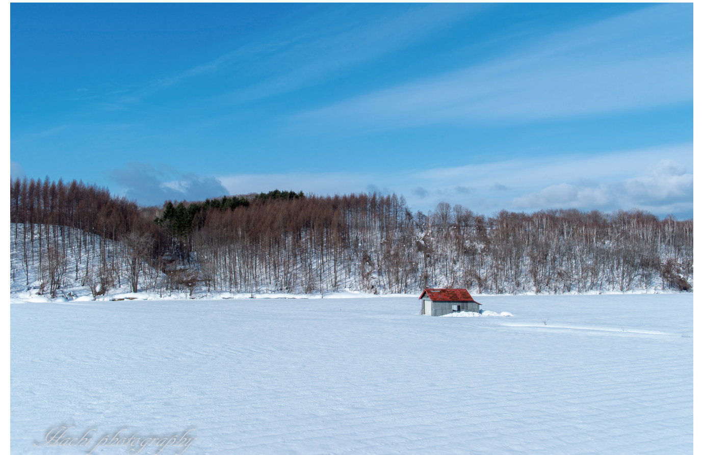
撮影日：2019年 撮影場所：旭川市

発行元 医療法人仁友会 北彩都病院 地域医療連携室 広報誌『地域医療連携室通信』編集事務局 〒070-0030 旭川市宮下通9丁目2番1号 TEL:0166-26-6411(代表) FAX:0166-26-6417(直通) URL: https://kitasaito.jinyukai.jp/